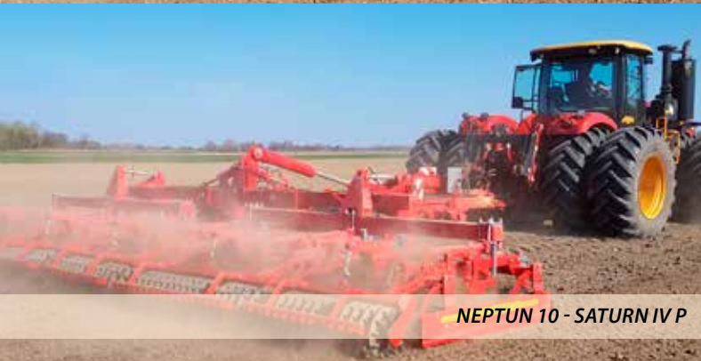
NEPTUN 10 - SATURN IV P

Alapfelszereltség: precíziós magágykészítő kompaktor 8 és 10 m munkaszélességben, vontatott kivitel egy univerzális eszközhordozóval, D50 vagy K80 vonófej, 560/45-R22,5 méretű futóműszállítási, szélesség 3m, 2x3db rugózott nyomlazió, munkavégző egység: Ø330 mm szélespálcás henger az első sorban, rugófeszítésű simítólap, paralelogramma függesztésű kaptagok 2 sorban, 265mm széles lúdtalpkapák a jobb átfedésért, NON-STOP spirálrugós kapabiztosítás, Ø330 mm szélespálcás henger a kapák után, rugófeszítésű simítólap, Crosskill lezáró henger, közúti világítás, oldalsó lezáró lemez.